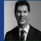
ティモシー・ スタット